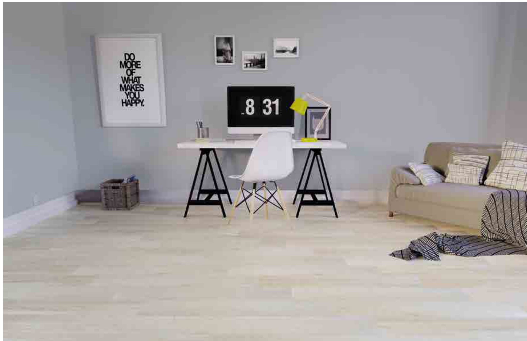
District Vainilla 15x90 cm. / 5,9x35,1" ▲