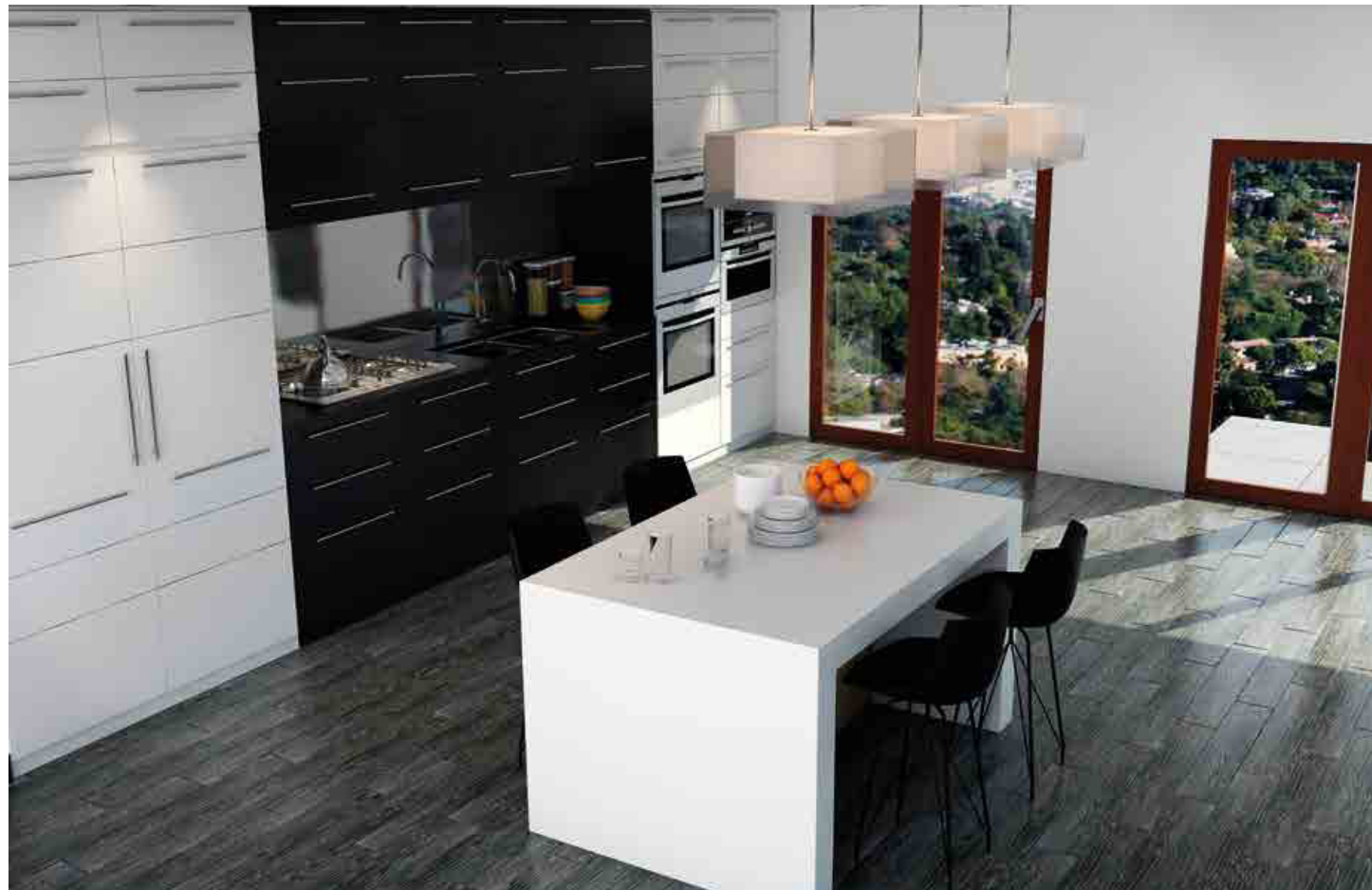
District Noir 15x90 cm. / 5,9x35,1" ▲