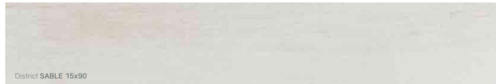
District SABLE 15x90