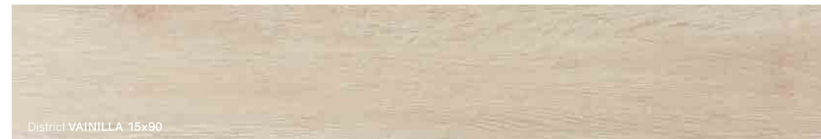
District VAINILLA 15x90