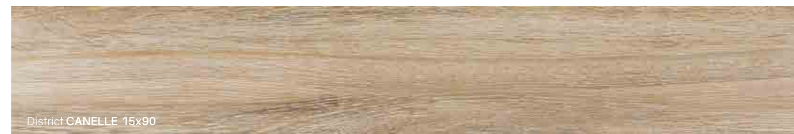
District CANELLE 15x90