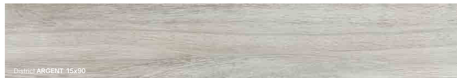
District ARGENT 15x90