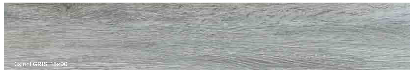
District GRIS 15x90