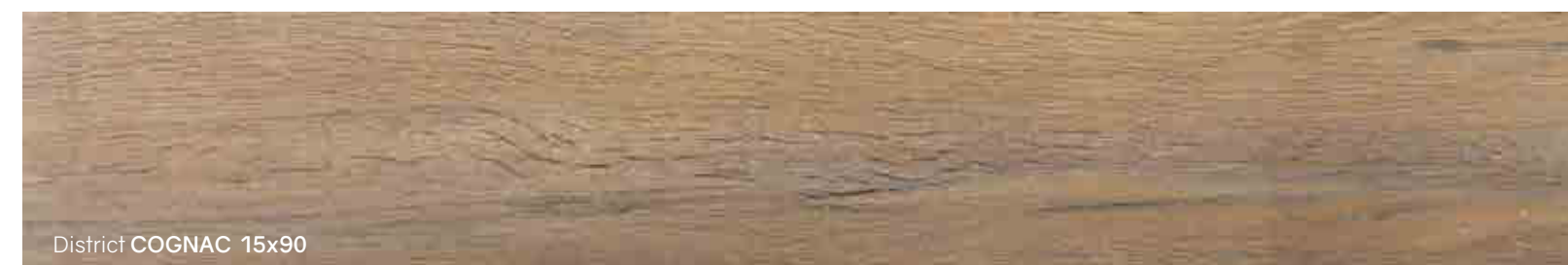
District COGNAC 15x90