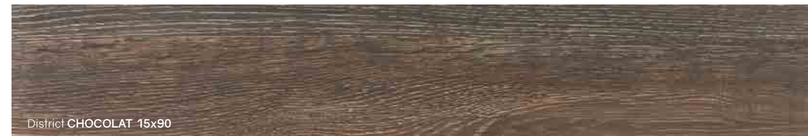
District CHOCOLAT 15x90